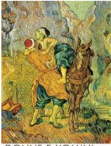
DONNE E UOMINI CAPACI DI CARITÀ

PARROCCHIE DI PONTERANICA – RAMERA - ROSCIANO