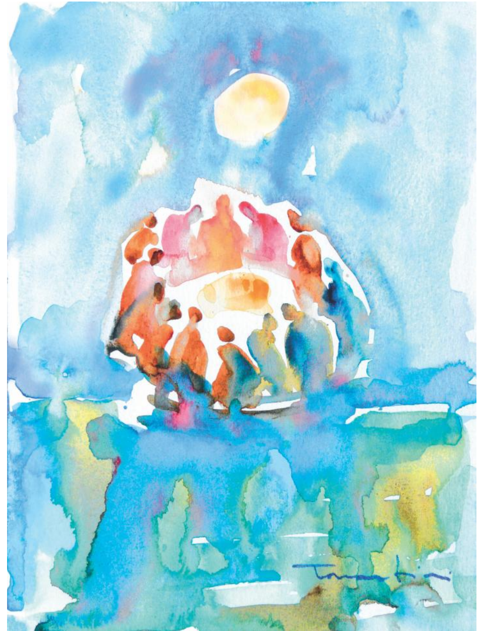
Carlo Tarantini, Chiesa: tra cieli nuovi e nuova terra, 2012 (Collezione privata)